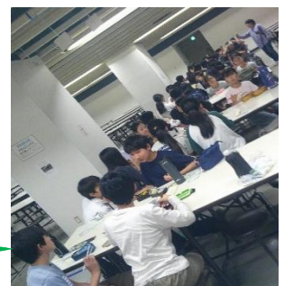
お弁当を食べています

早朝の事故の影響で都心環状線が通行止めとなり、かなりの渋滞が発生しました。科学技術館への到着までに2時間半ほどかかってしまったため、急遽予定を変更し、お昼ご飯を食べてから見学を行いました。時間に余裕がなく、かけ足での見学となってしまいましたが、すべてのグループが時間を守って集合時間に集まることができました。