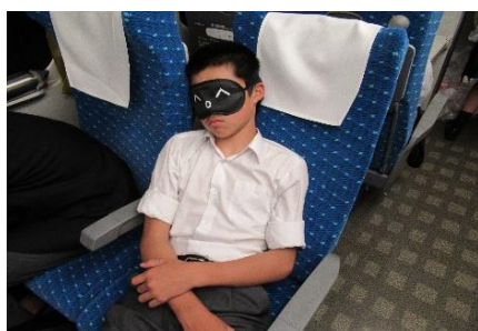
17時37分 新横浜駅到着 お疲れさまでした……。

新年度が始まり、約1か月での修学旅行の実施でしたが、生徒たちは慌ただしさのなか、良く取り組んでくれました。旅行後の事後学習の発表も素晴らしい発表ができました。