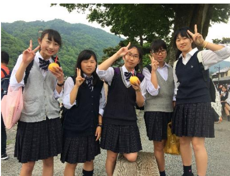
体験後、嵐山に移動、昼食場所「良彌」