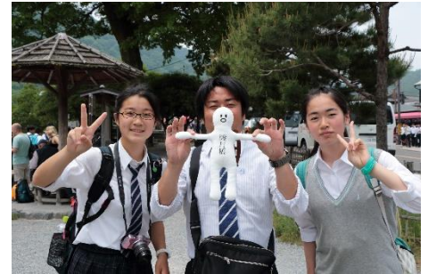
昼食後、最後の見学場所、 「嵐山」「渡月橋」