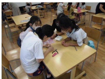
コンチョボタンのゴムバンドづくり A