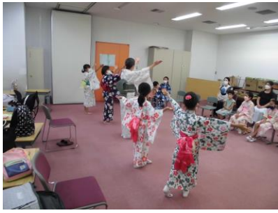
和の心 日本舞踊を踊ってみよう