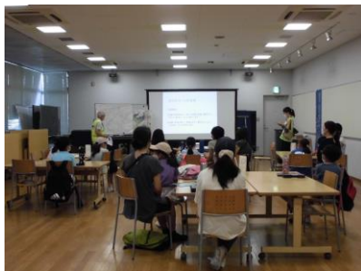
みんなはどうする？地震が来たら