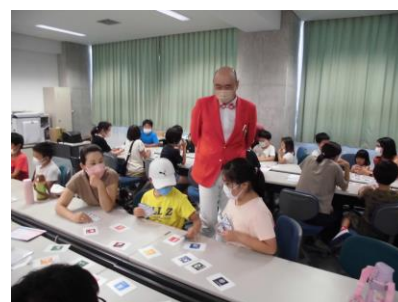
SDG s ババ抜きカードゲーム体験

「コンチョボタンのゴムバンドづくり」はPTAの『手作り同好会』の皆さんが講師でした。