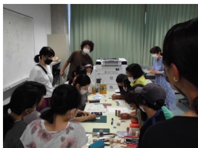
古代文字でハンコを作ろう A