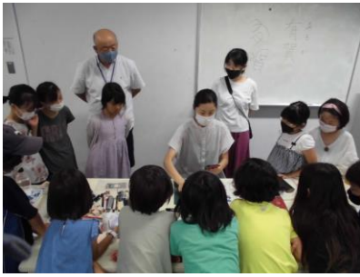
古代文字でハンコを作ろう C

「みんなはどうする地震が来たら？」は『逗子災害ボランティアネットワーク』の方々から、大きな地震が来たらどうしたらよいか教えていただきました。