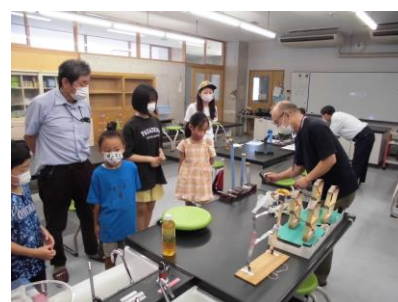
どうして地震は起こるの？