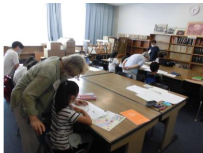
わくわく子ども短歌教室

「子ども薬局 A・B」は、『ココカラファイン』主催の講座で、参加した児童は、白衣を着て薬剤師さん体験をしました。