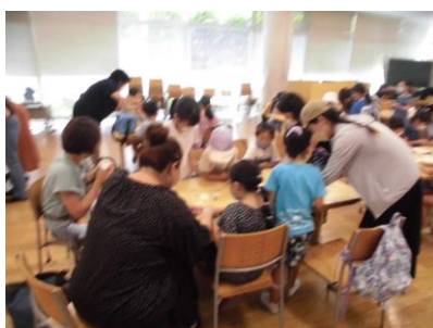
コンチョボタンのゴムバンドづくり B