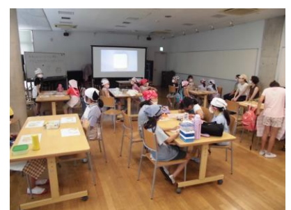
アイシングで150周年オリジナルクッキーを作ろう B