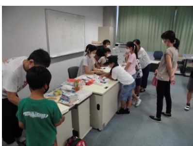
古代文字でハンコを作ろう B