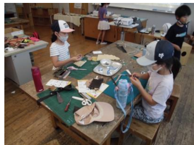
レザークラフト体験 B