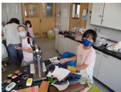
カラフルレザーバッチづくり B