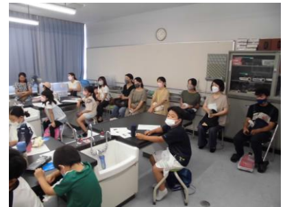
足育相談室 (アキレス)