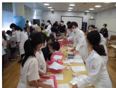
子ども薬局 B (ココカラファイン)