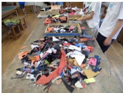
レザークラフト体験 A