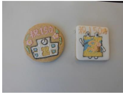
アイシングで150周年オリジナルクッキーを作ろう A

「プラスチックを学んで新しい物を作ろう」では、いらなくなったプラスチックを圧縮・過熱して魚のキーホルダーを作りました。