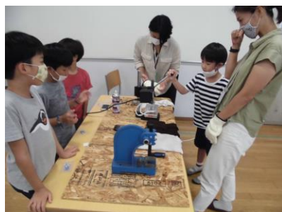
プラスチックを学んで新しいものを作ろう！