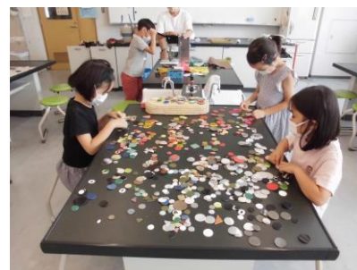
カラフルレザーバッチづくり A