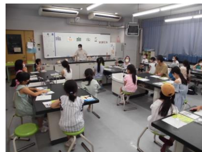
香織の教室 アロマスプレー作り