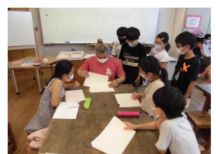
アニメーション教室