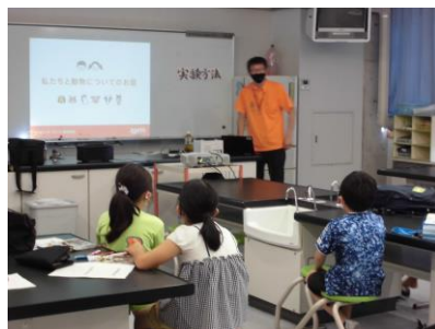
動物についてのお話