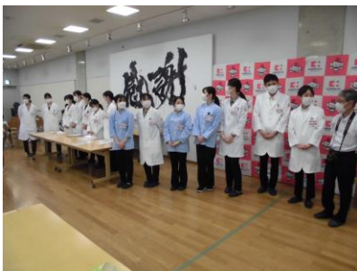
子ども薬局 A (ココカラファイン)