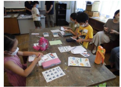
お金の使い方講座