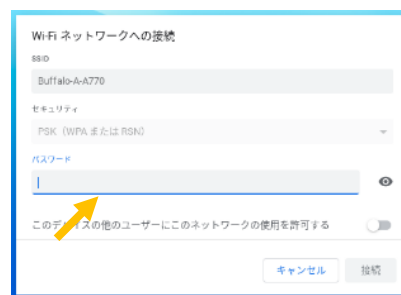
3. 接続パスワードを入力