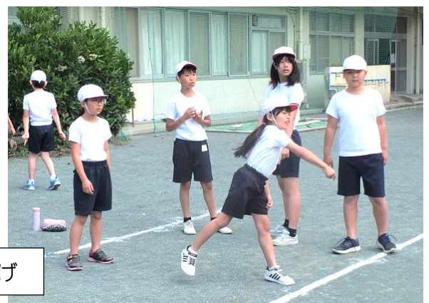
ソフトボール投げ

＜体力・運動能力調査＞ 6月11日（火） 体力・運動能力調査を行いました。たてわり班に分かれて、6年生がリーダーとなって5種目に取り組みました。この日取り組んだのは、ソフトボール投げ・反復横とび・立ち幅とび・長座位体前屈・上体起こしの5種目で、残りの50m走・20mシャトルラン・握