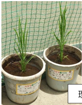
理科室前のバケツ稲