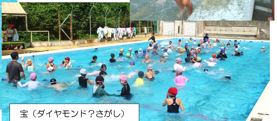
宝（ダイヤモンド？さがし）